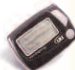
Múltiplas Linhas Alfanuméricas