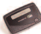
Uma linha Alfanumérica