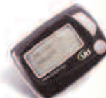
Multiplas Linhas Alfanuméricas