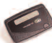
Uma linha Alfanumérica