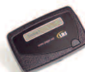
Alphanumeric a una riga