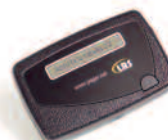
Alphanumeric a una riga