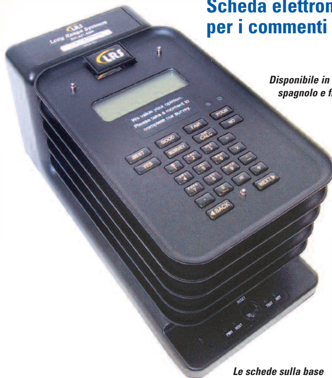
Le schede sulla base

Disponibile in inglese, spagnolo e francese